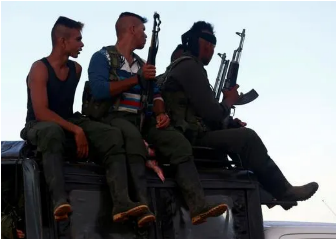
Foto de archivo. Antiguos integrantes de las Fuerzas Armadas Revolucionarias de Colombia (FARC) se desplazan en un vehículo cerca al Diamante, en los Llanos del Yarí - Yahoo news

Este incremento de los homicidios en Colombia y algunas ciudades capitales está asociado al crecimiento y accionar de estructuras criminales organizadas que se disputan las distintas rentas criminales como el narcotráfico, microtráfico, minería ilegal, trata de personas, comercio ilegal de armas, contrabando, extorsión y algunas modalidades de hurtos. Rentas criminales que se disputan de manera violenta, de ahí que el sicariato se haya disparado en el país.